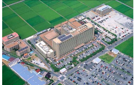
埼玉医科大学総合医療センター (埼玉・川越)